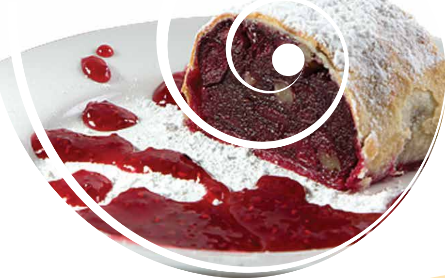
ШТРУДЕЛЬ ВИШНЁВЫЙ (ВЫПЕЧКА)