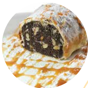
ШТРУДЕЛЬ МАКОВО-ОРЕХОВЫЙ (ВЫПЕЧКА)