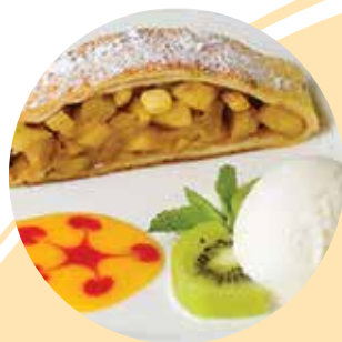
ШТРУДЕЛЬ ЯБЛОЧНЫЙ (ВЫПЕЧКА)