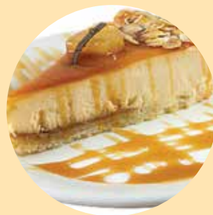
ЧИЗ-КЕЙК "КАРАМЕЛЬНЫЙ" (ТОРТ)